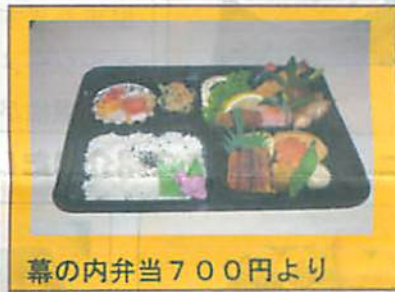
幕の内弁当700円より