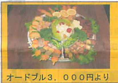
オードブル3,000円より