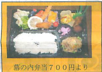
幕の内弁当700円より